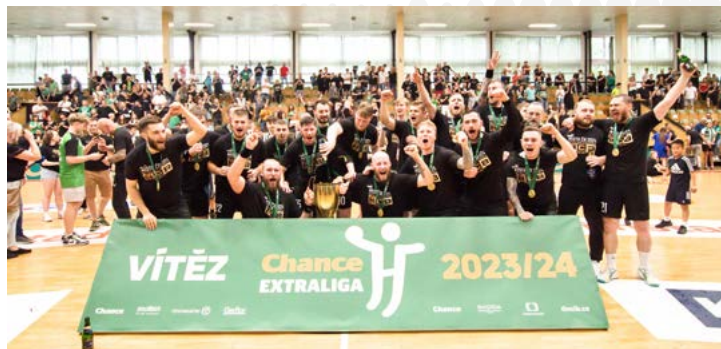
Emoce, radost, euforie a zadostiučinění – vítězové a mistři 2023/24