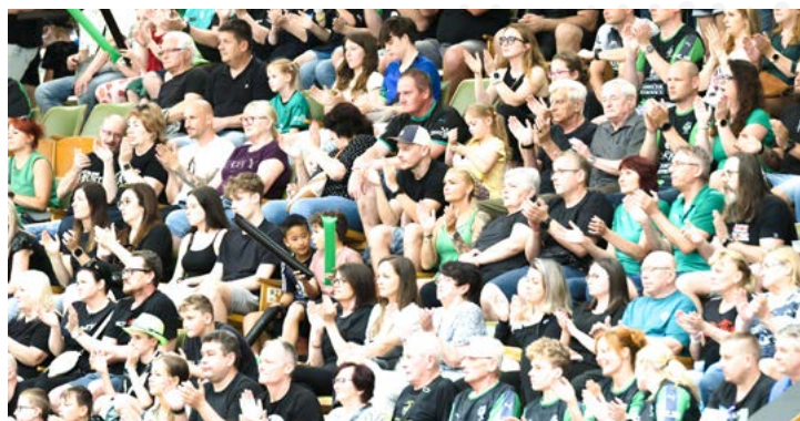
Fanoušci HCB Karviná byli po celou sezónu dalším hráčem na hřišti.