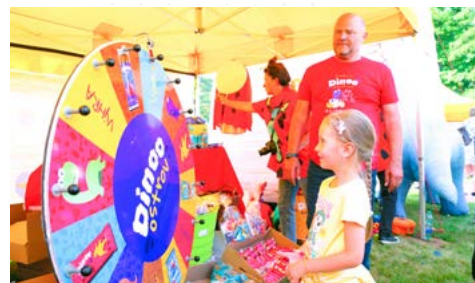
Na dnech Karviné s Hornickými slavnostmi si našel každý to své. Nechyběl pestrý program pro děti, ani Nadační městečko OKD.