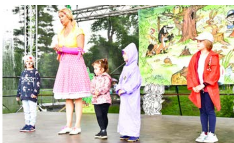
Den pro celou rodinu na Lodičkách nabídl pestrý program, takže ani proměnlivé počasí nezkazilo přítomným náladu.