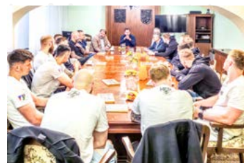
Přijetí a poděkování na radnici