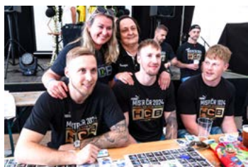
Mistrovská párty na Lodičkách