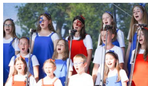
Koncert Permoníku na Lodičkách představil to nejlepší ze všech přítomných souborů, což diváci opakovaně ocenili potleskem.