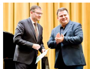
Udílení výročních cen 2023