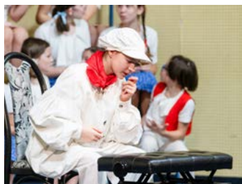
Literárně dramatický obor