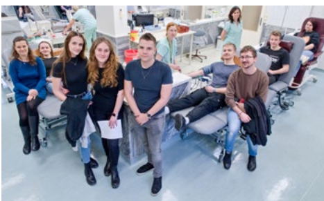
Studenti Střední zdravotnické školy Karviná