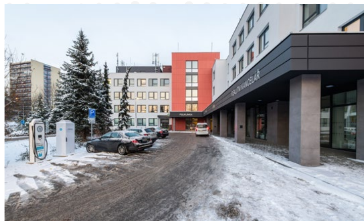
Rekonstrukce polikliniky bude pokračovat i v letošním roce.