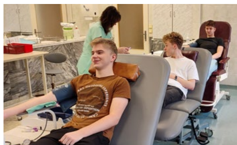
Studenti Gymnázia Karviná