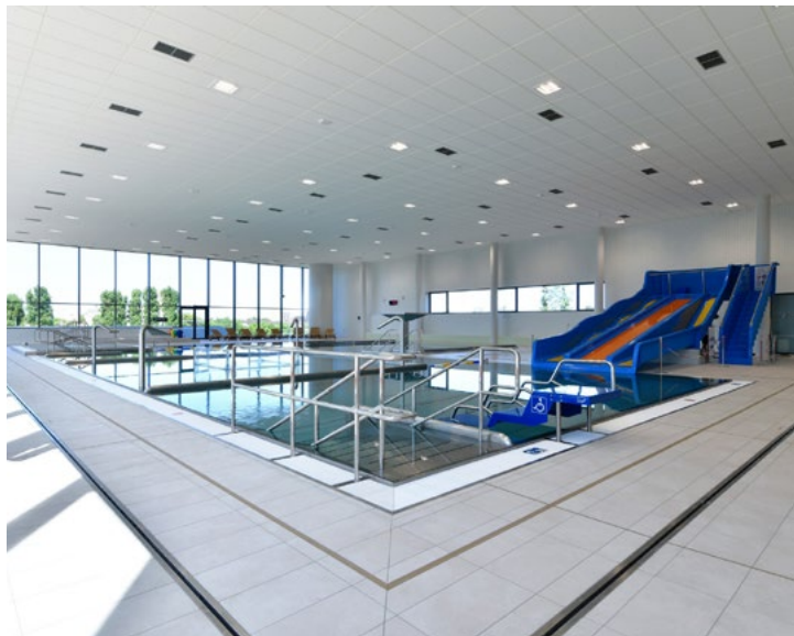
Zmodernizovaný Městský bazén znovu slouží od srpna 2023.

„Jsou důležitou a nedílnou součástí života našeho města. Regionální knihovna je za svou činnost pro občany každoročně hodnocena jako jedna z nejlepších knihoven v republice, za což patří obrovské díky všem zaměstnancům. Stejně tak Sociální služby Karviná, které poskytují služby na vysoké úrovni pro seniory či hendikepované lidi. Vážím si jejich profesionální práce a snažíme se je podporovat, jak jen to jde.“