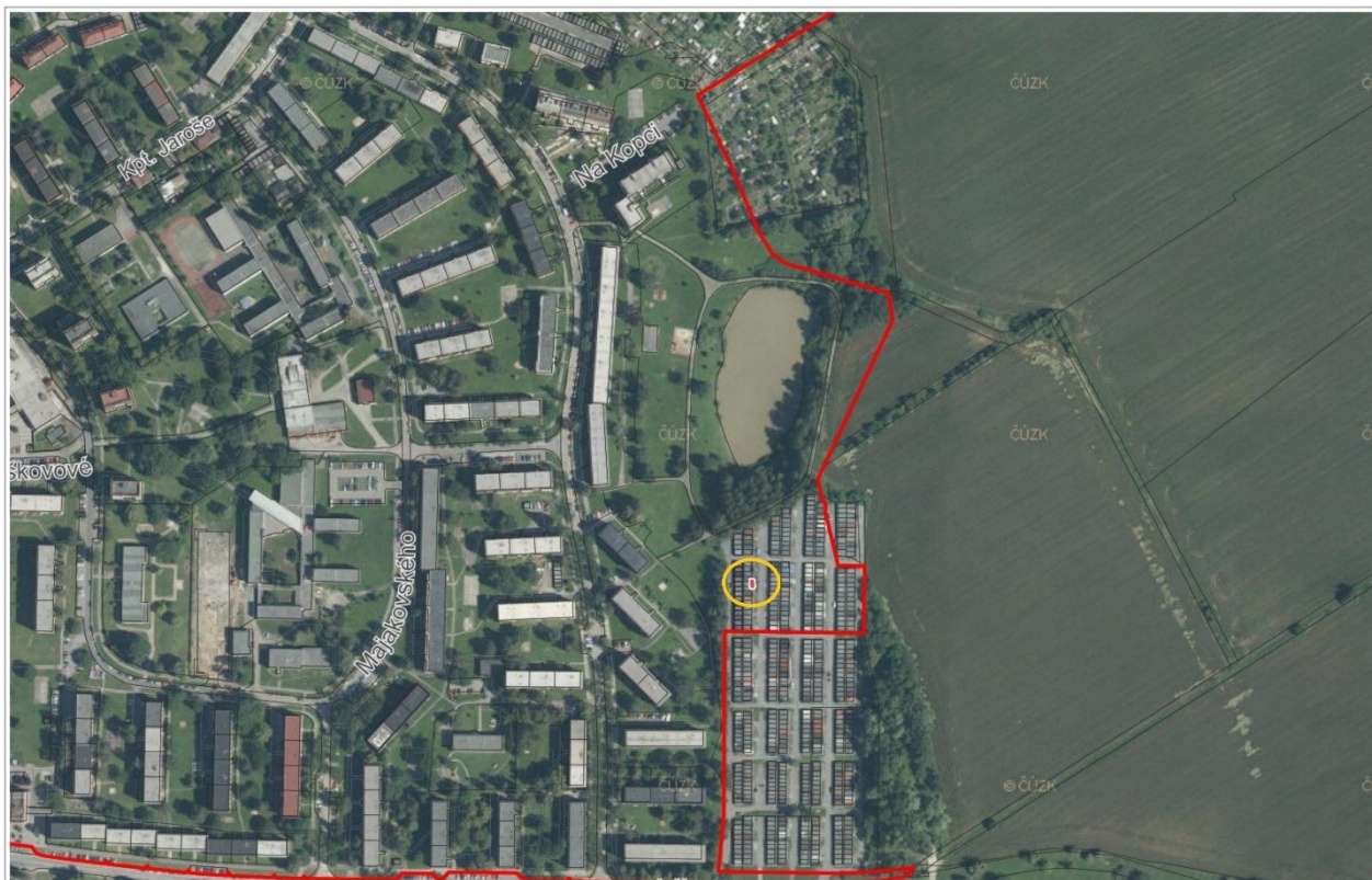
Ortofoto: © ČÚZK, Katastr: © ČÚZK, RÚIAN: © ČÚZK