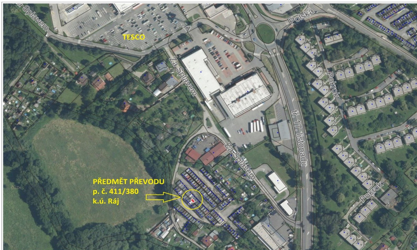
Ortofoto: © ČÚZK, Katastr: © ČÚZK, RÚIAN: © ČÚZK