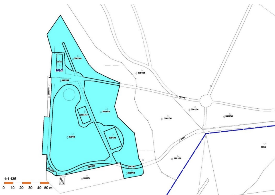
Mapa č. 2

Vymezení oblasti areálu Loděnice v parku Boženy Němcové v Karviné Fryštátě