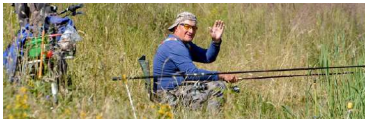
Rybářský lístek vyřizujeme na počkání

V oblasti regenerace panelových domů bylo v letošním roce největším trendem povolování předsazených lodžii na bytových domech, instalace výtahů v nevyužitých výťahových šachtách bytových domů a stále se také povolují zateplení staveb bytových domů.