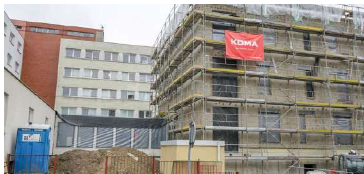
Přístavba bloku Karvinské hornické nemocnice

V letošním roce započalo statutární město Karviná s demolicí bytového domu Kosmos a Ředitelství silnic a dálnic s výstavbou obchvatu Karviné.