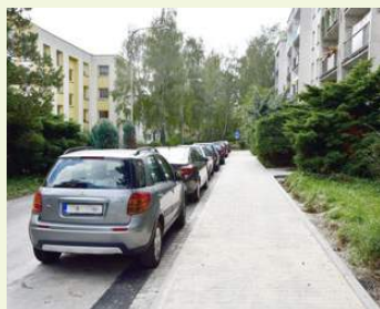
Chodníky na ulici Okružní zdobí nová zámková dlažba.