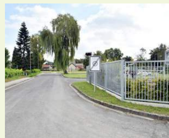
Oprava komunikace na ulici Polní právě probíhá.