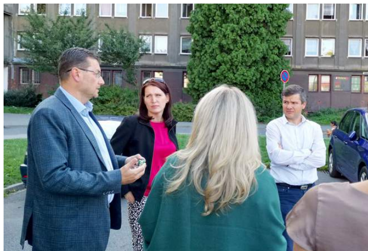
Zastávka v Karviné-Novém Městě a téma obchodníci s chudobou