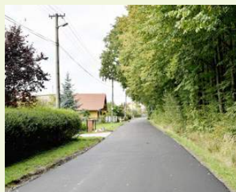
Na ulici Mickiewiczova proběhla výměna povrchu a zpevnění krajnice.