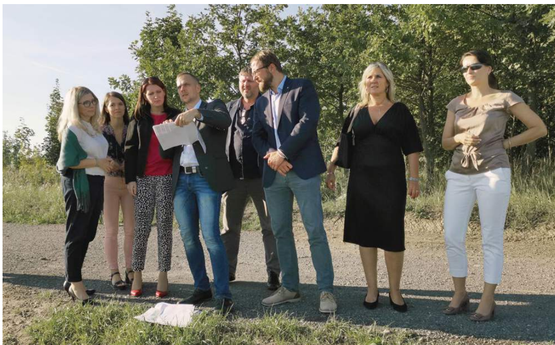
Zástupci Ministerstva pro místní rozvoj ČR se zajímali (mimo jiné) také o budoucnost Karvinského moře

Integrovaný plán Karviná všemi deseti obsahuje celkem 15 projektů, kterými se postupně snaží město měnit. „Projekty jsou zaměřeny na ekonomickou oblast, jako například vytváření nových