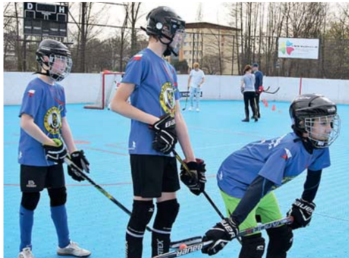
TĚŽKO NA CVIČIŠTI... platí i v hokejbalu