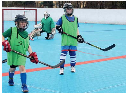
BUDOUCÍ OPORY „A“ týmu nebo i reprezentace