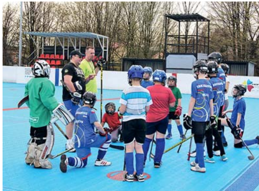
PRAVIDELNÝ TRÉNINK je základ přípravy