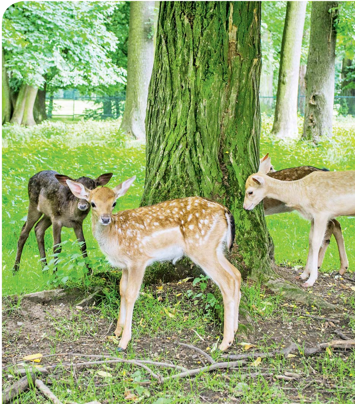
Teplé dny lákají k procházkám po krásách našeho města