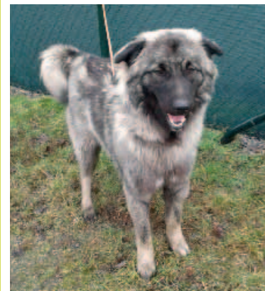
KIRA, fena, 2 roky, šedá.

Psí útulek, ul. Brožíkova, Karviná-Darkov, tel.: 727 869 211