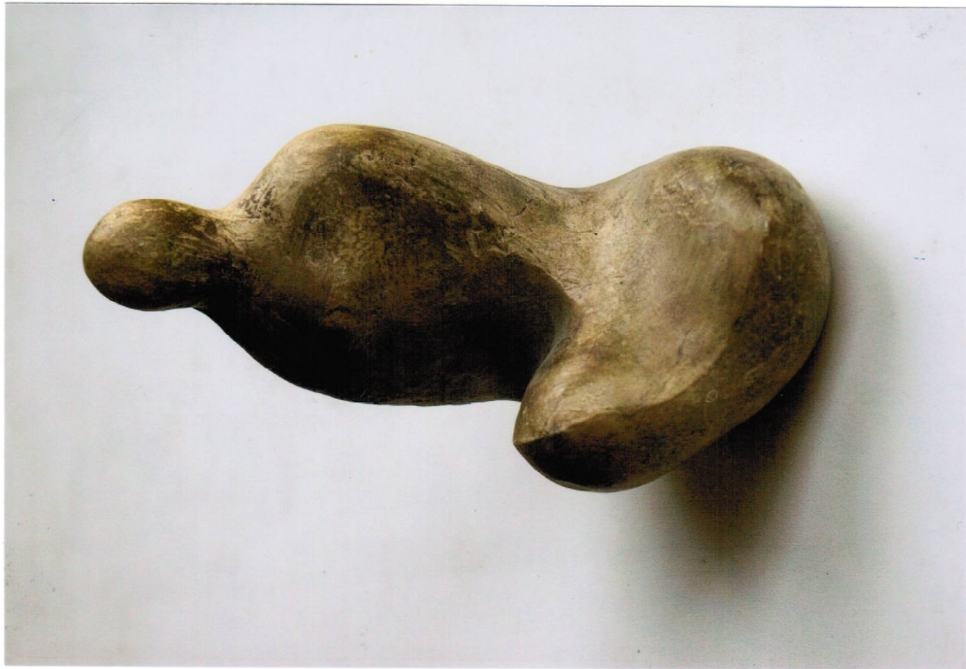
15. socha (16 cm) – sádra, cena Kč 17.000,-