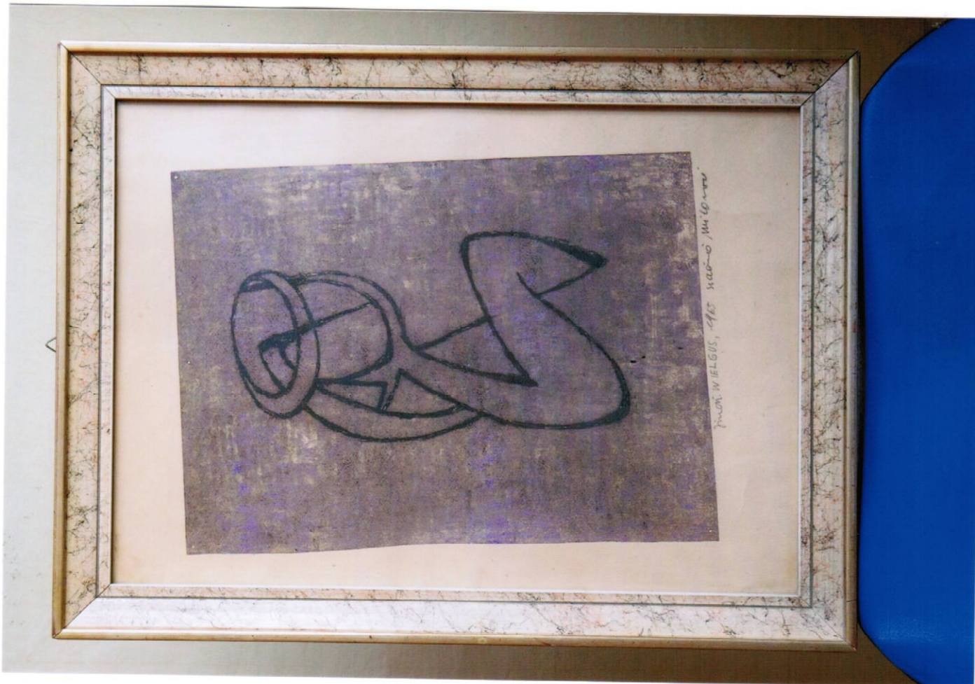
3. obraz (36 x 48 cm) – pastel, cena Kč 12.000,-