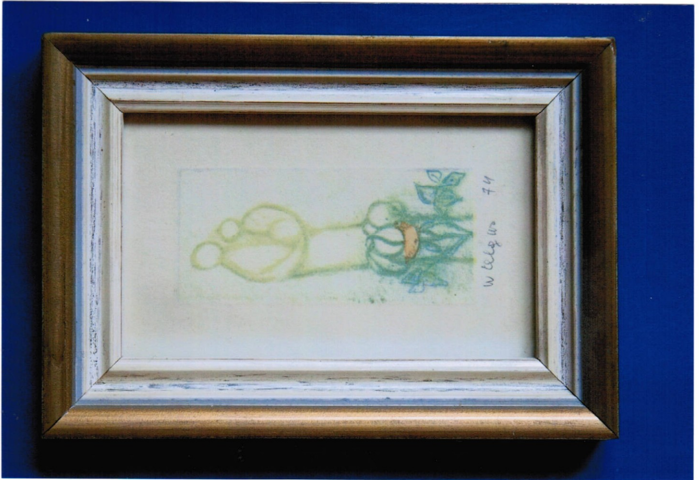
9. obraz (12 x 17 cm) – pastel, cena Kč 12.000,-