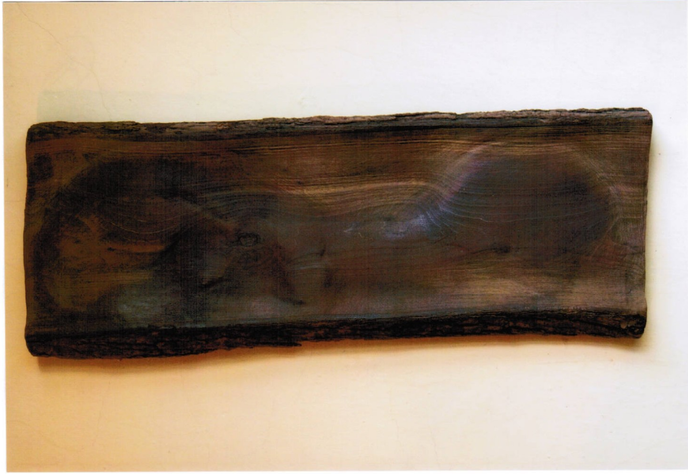
12. plastika (30 x 80 cm) – dřevo, cena Kč 17.000,-