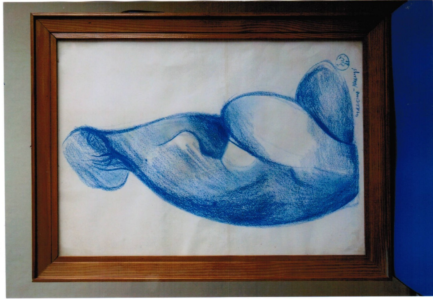
11. obraz (33 x 45 cm) – pastel, cena Kč 12.000,-