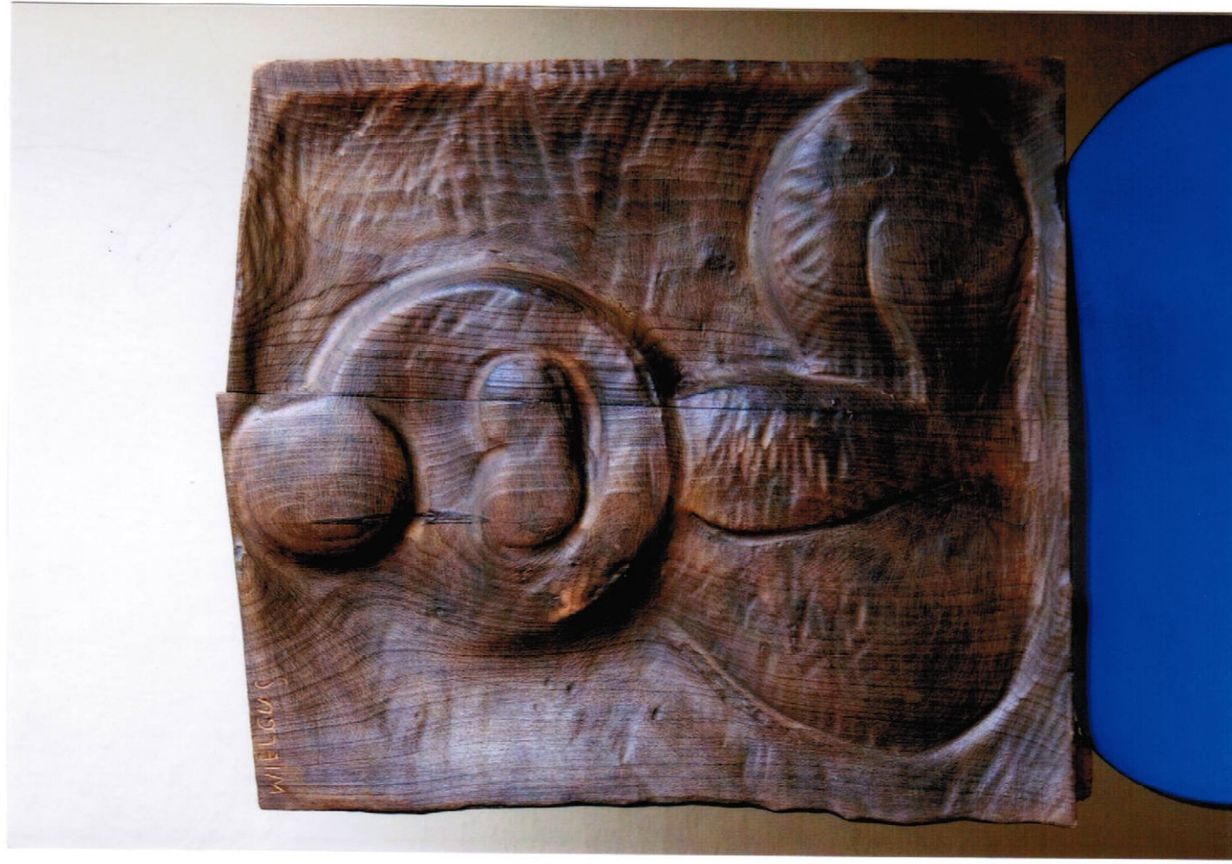
14. plastika (42 x 47 cm) – dřevo, cena Kč 17.000,-