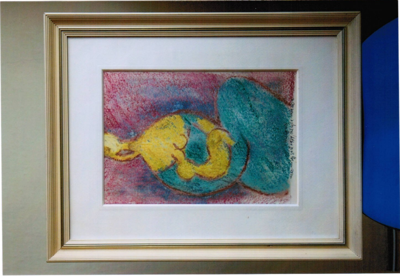
8. obraz (48 x 60 cm) - pastel, cena Kč 12.000,-