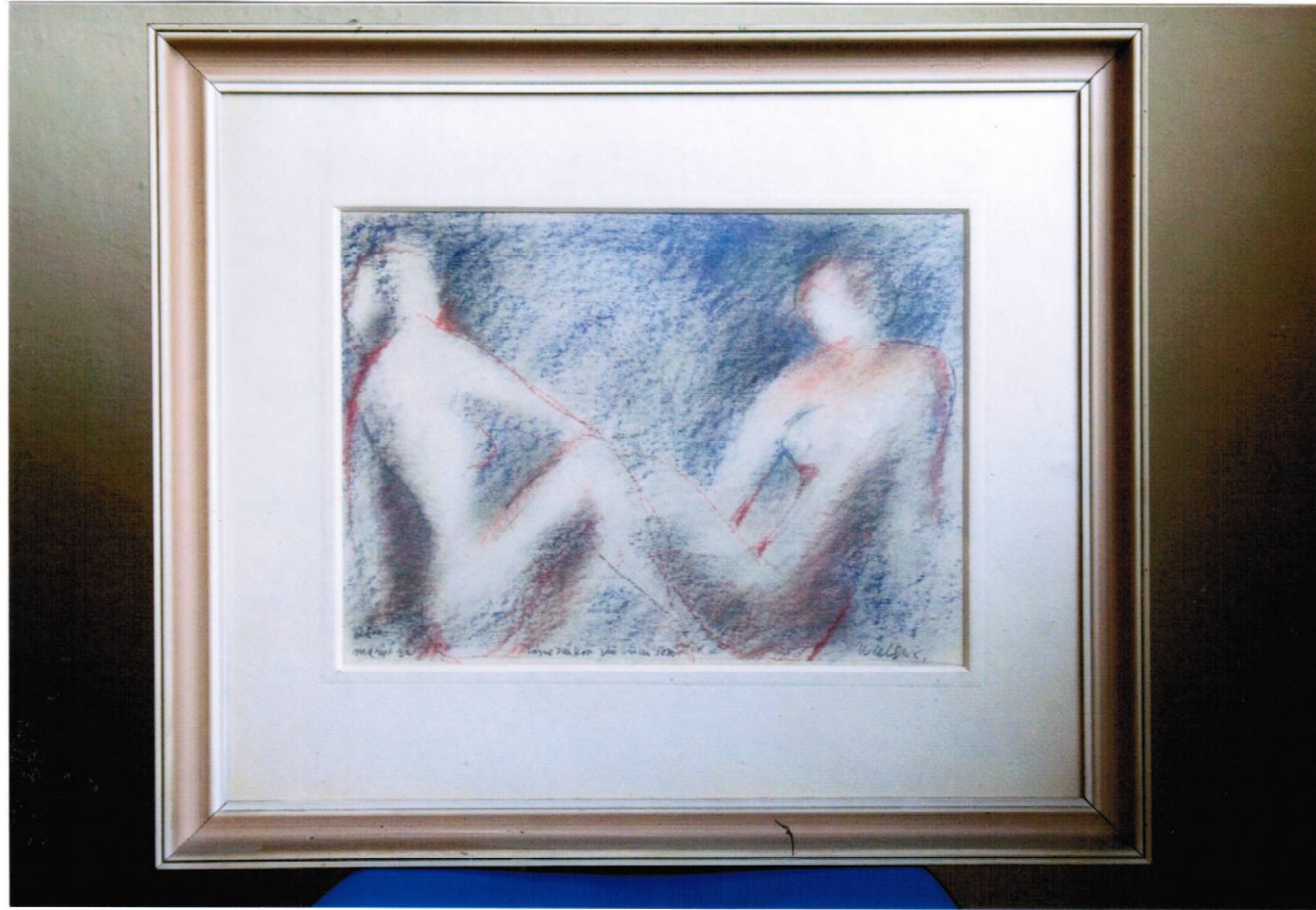
5. obraz (48 x 56 cm) – pastel, cena Kč 12.000,-