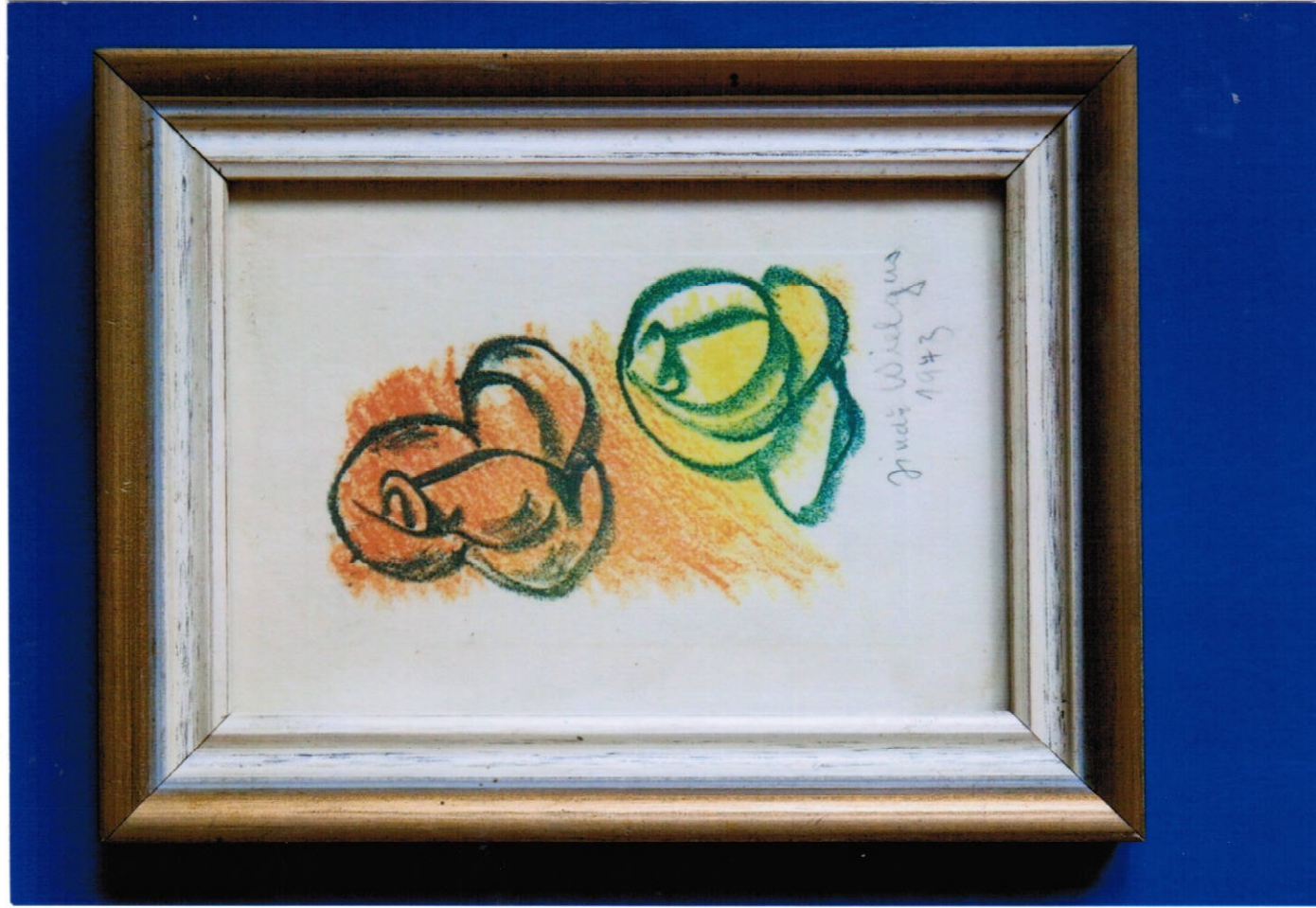
1. obraz (15 x 20 cm) – pastel, cena Kč 12.000,-