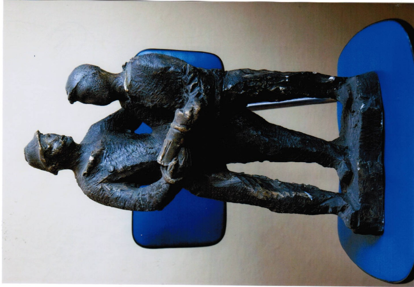
13. sousoší (51 cm) – sádra, cena Kč 17.000,-