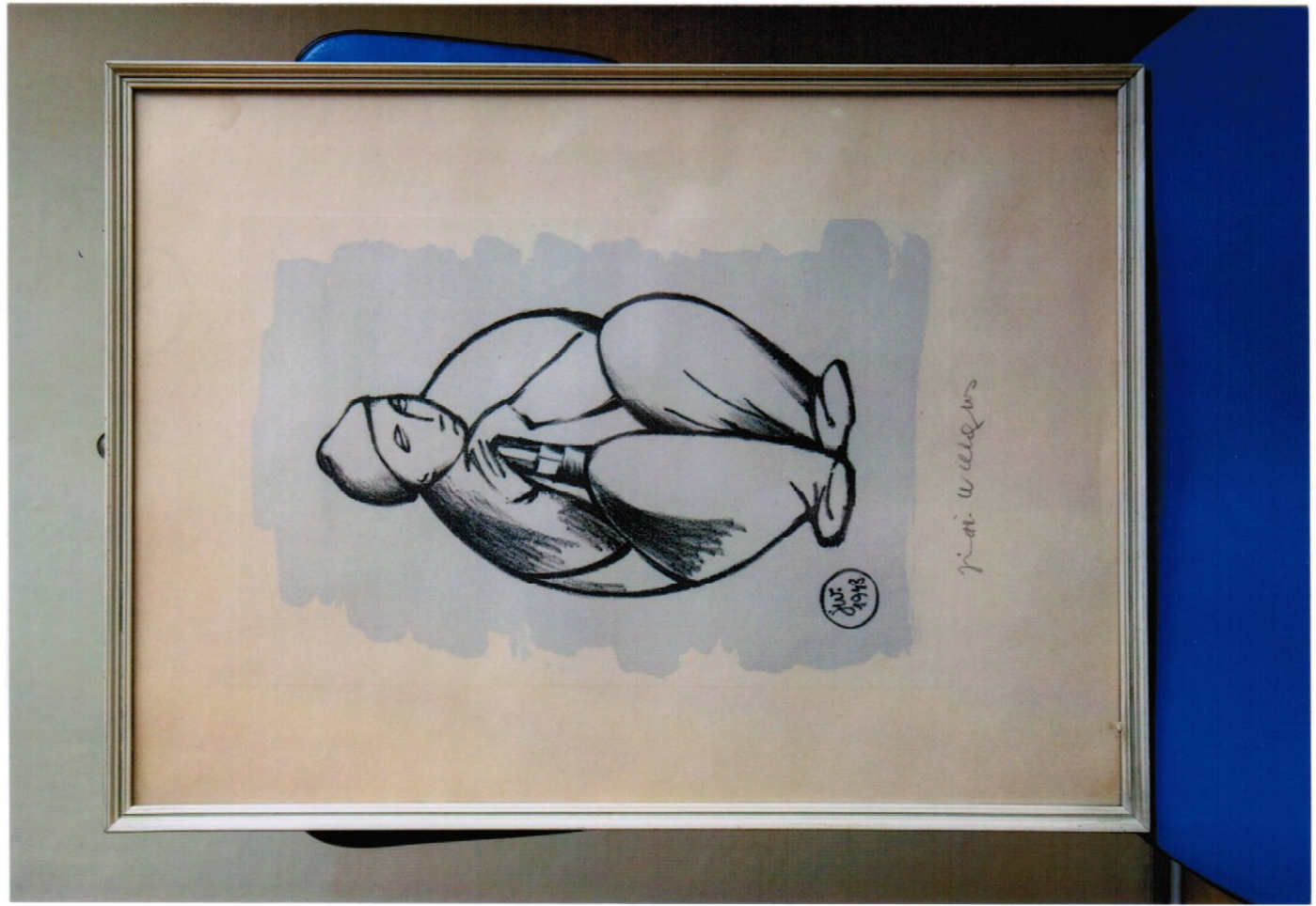
10. obraz (32 x 43 cm) – uhel, cena Kč 12.000,-