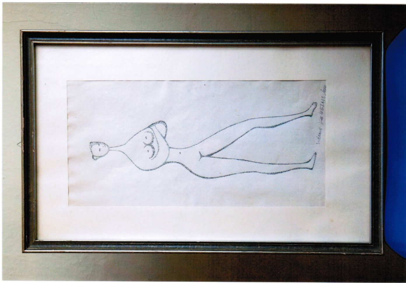
4. obraz (37 x 60 cm) – tužka, cena Kč 12.000,-