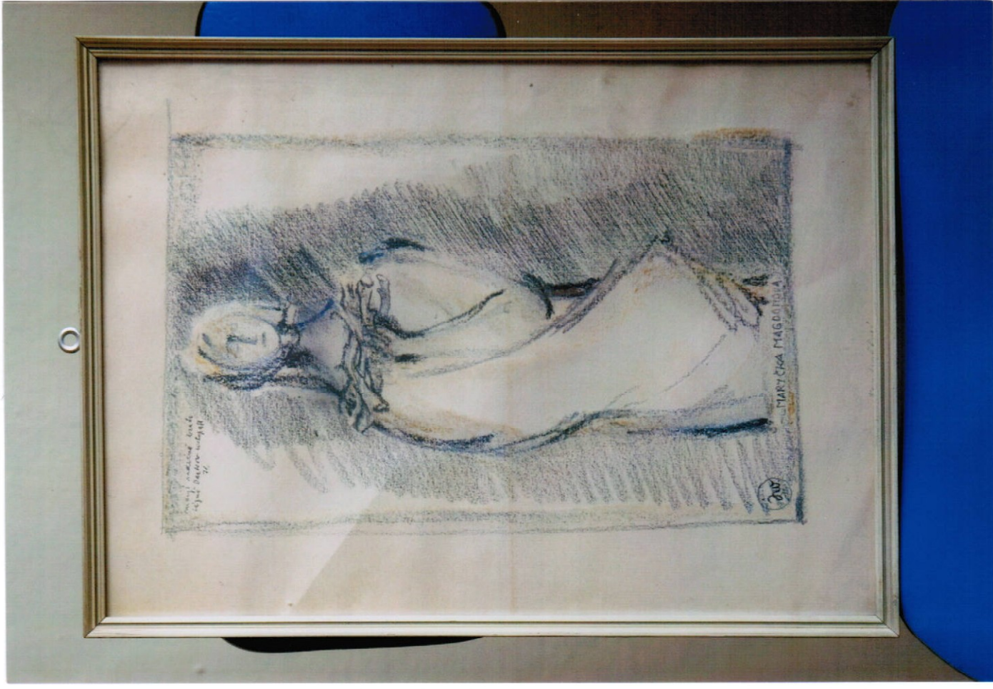
2. obraz (30 x 41 cm) – tužka, cena Kč 12.000,-