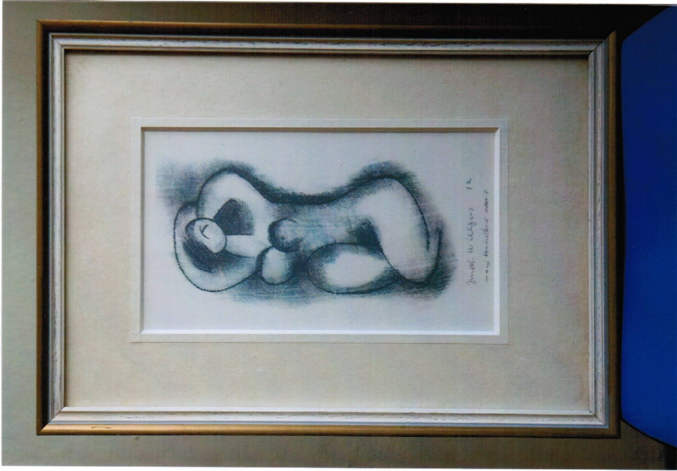
6. obraz (35 x 50 cm) – uhel, cena Kč 12.000,-